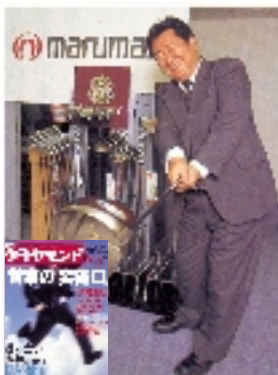
週間ダイヤモンド5月号より抜粋